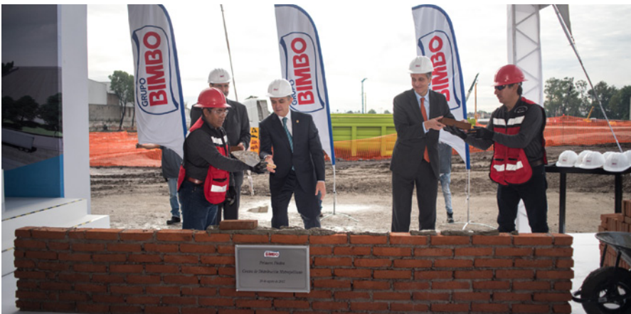
Der Grundstein ist gelegt. Grupo Bimbo CEO Daniel Servitje (2.v.r.) mit dem Bürgermeister von Mexiko-Stadt, Miguel Ángel Mancera (Mitte).

ERP-Systemen. Des Weiteren bietet Logis sehr detaillierte Analysemöglichkeiten bis auf Artelebene und ermöglicht somit maximale Transparenz und Nachvollziehbarkeit der Warenflüsse. Egal ob auf Smartphones, Tablets, Smart Glasses, robusten Industriecomputern oder über den Desktop-Leitstand zur zentralen Steuerung der Workflows: Mitarbeitende verwalten die Warenflüsse digital auf allen Endgeräten. Ebenso ist der Einsatz von RFID-Technologien möglich. Weitere Informationen zur konkreten Umsetzung von Automatisierung und Digitalisierung entlang der gesamten Supply Chain finden Sie auf www.dataphone.ch ■